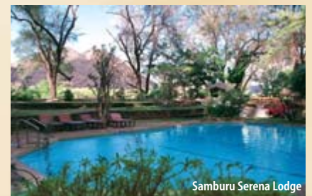
Samburu Serena Lodge