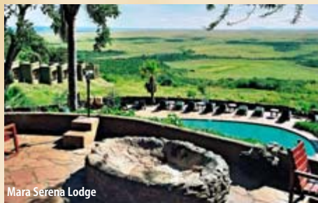
Mara Serena Lodge